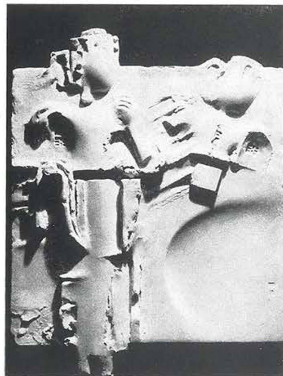
10. Pesnik i model