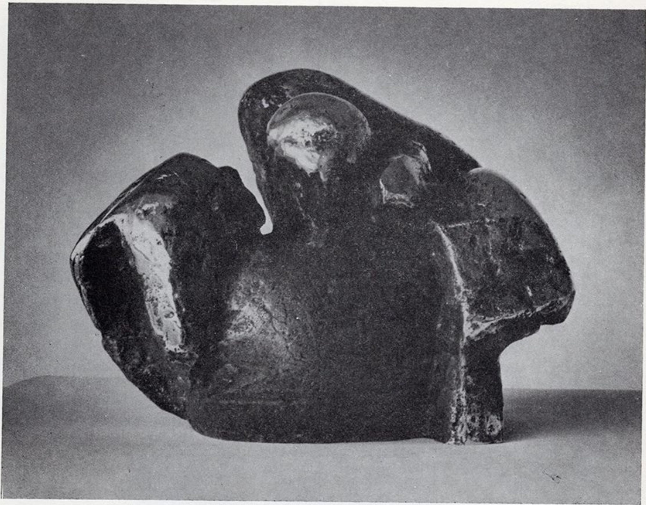
Б. Продановић: РАТ