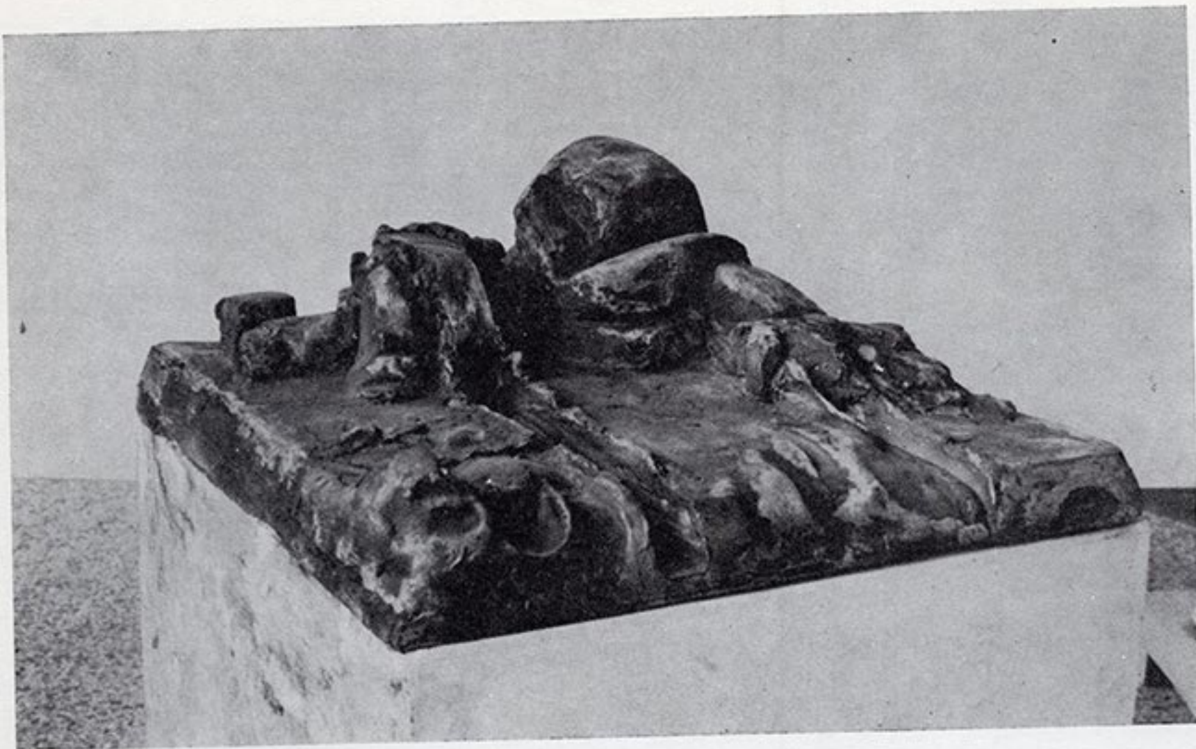
Б. Продановић: У ПРОСТОРУ