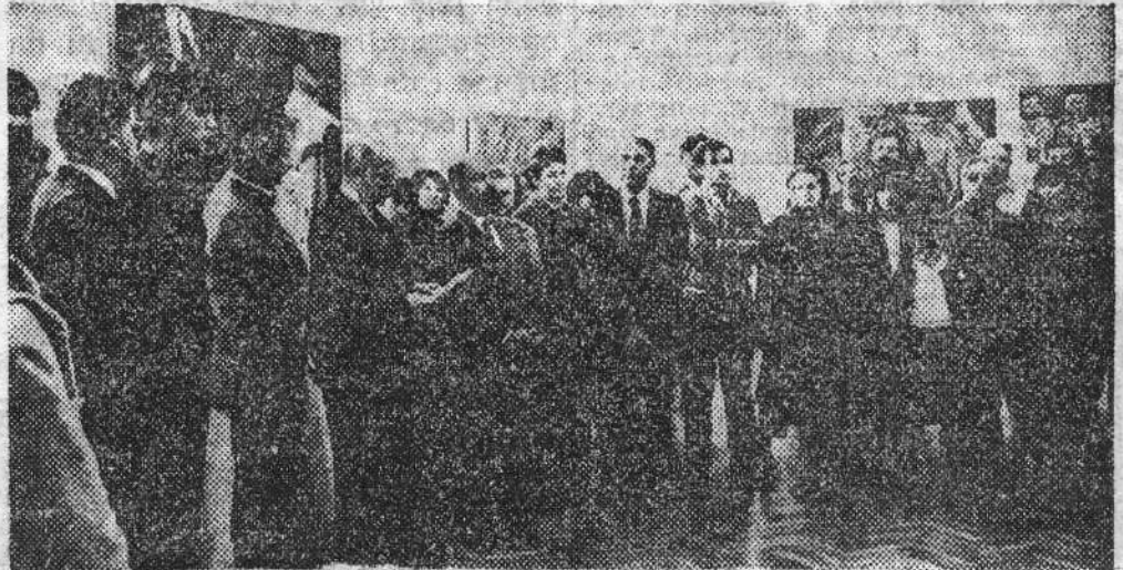
Са отварања Бијенала у Народној музеју