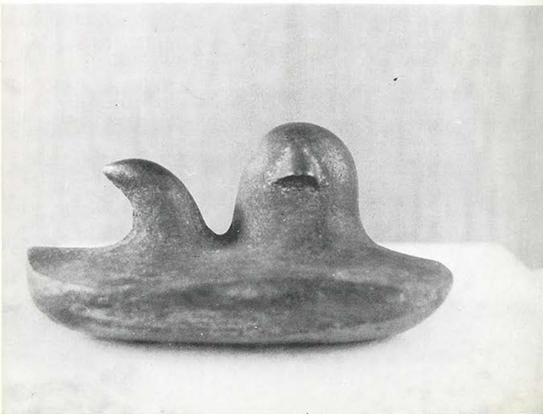
RIBAR 1983, bronza