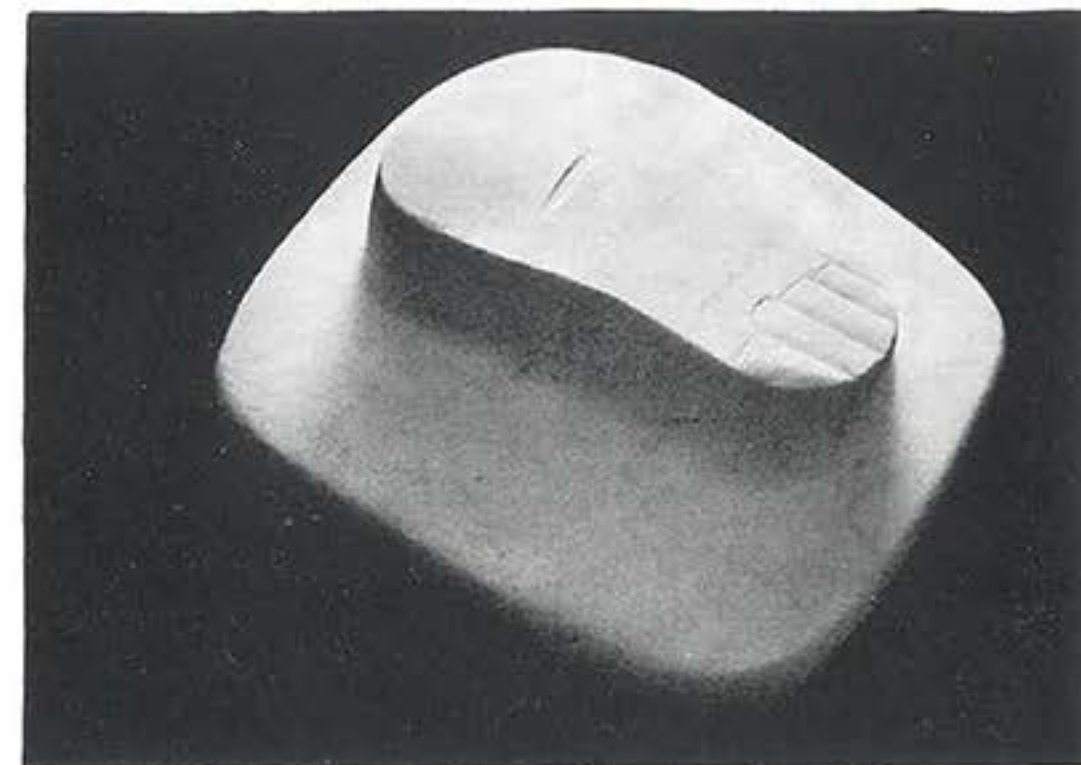
STOPA, 1982, mramor