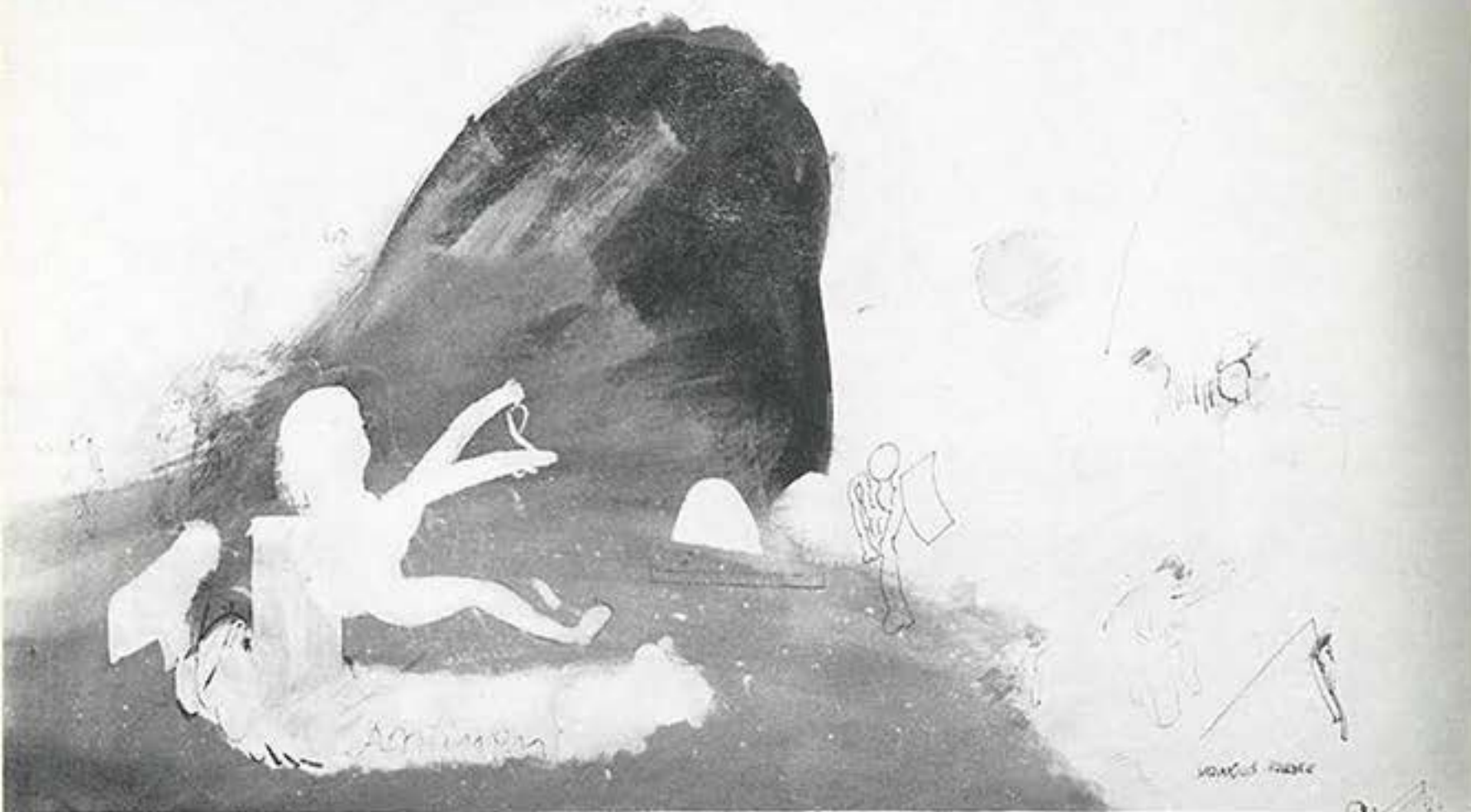
CRTEŽ, 1983, komb. tehnika