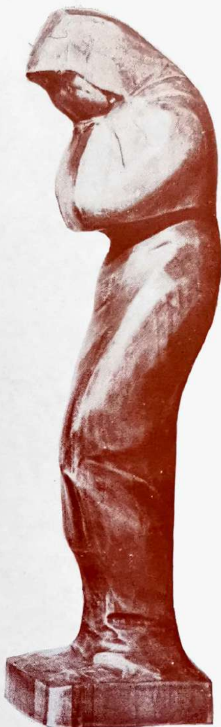
SIRATÓ ASSZONY NARIKAČA, 1965.